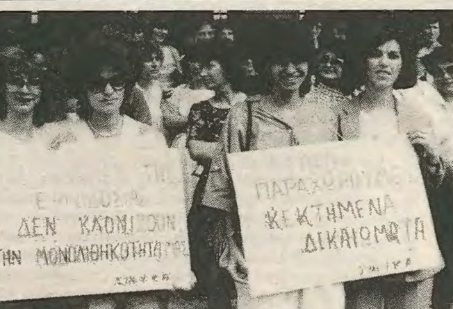
Απο τις απεργιακές κινητοποιήσεις του 1985. Οι υπάλληλοι των Κ. Αερογραμμών είναι έτοιμοι για νέους αγώνες.

Μέσα στα αντιαιτήματα της εταιρείας, ξεχωρίζεται τόσο άλλα και η επιδίωξη, μέσα σε μακρόχρονο σχέδιο, να σπάσει την ενότητα των υπαλλήλων και να μελετημένα, ενώ αντίθετα τα περισσότερα αιτήματα της ΣΥΝΥΚΑ είναι αρκετά άβριστα και γενικά, και στα περισσότερα περι-ορίζεται στο «να συζητηθεί το όλο θέμα». Αυτό αυδυνατίζει πολύ τη διαπραγματευτική-της θέση, και ίσως δείχνει μια έλλειψη υπευθυνότητας στην αντιμετώπιση του θέματος